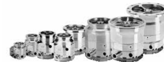
nEXT シリーズ ターボ分子ポンプ