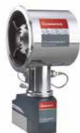
ON-Board IS CTI クライオポンプ