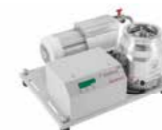
T-Station ターボ分子ポンプステーション