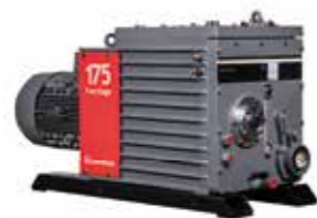
E2M ロータリーベーンポンプ EH ブースターポンプ