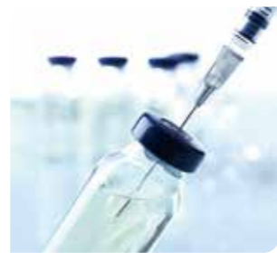
医療・ヘルスケア