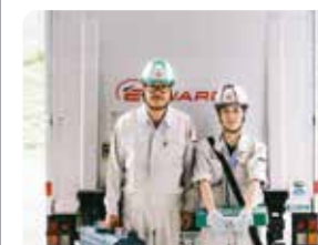
フィールドサービス