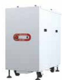
iXH MK2 シリーズ ドライポンプ