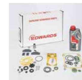
オイル・メンテナンスキット

フィールドサービスエンジニアによるオンサイトサービスを実施しています。サービス向上のデータを基にした Smart Service はお客様のトータルコスト削減に貢献しています。