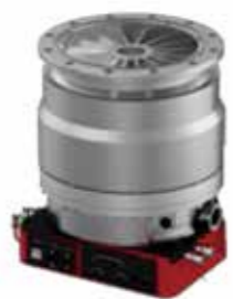
STP-iXA3306C 磁気浮上式ターボ分子ポンプ

半導体製造プロセスに必要な真空排気系（主排気と補助排気系）と、プロセスガスを処理するための除害装置を備えており、トータルシステムソリューションをご提案できる業界トップクラスのメーカーです。