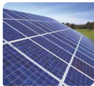
再生可能エネルギー