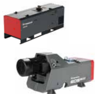
EXS/EDS ドライスクルーポンプ

製鋼プロセスでの真空脱ガス、冶金、コーティング、エネルギー生産プラントなどをはじめその他多くの産業向けに、広範な真空技術とソリューションを提供しています。弊社の誇るクリーンで堅牢なドライ真空ポンプは環境へ配慮すると同時に、運用コストの削減にも寄与いたします。