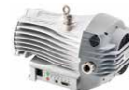
nXDS ドライスクロールポンプ