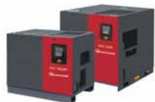
EOSi オイルシール型 ロータリースクルーポンプ