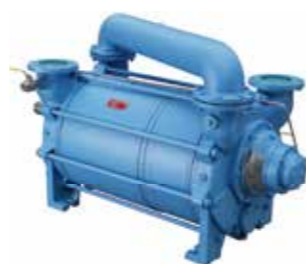
LRP 液体リング真空ポンプ