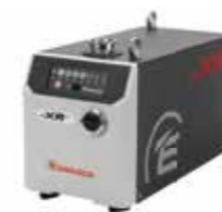
nXRi ドライルーツポンプ

研究プロセス及びそのすべての段階で真空が果たす役割についての深い知識と、革新的な技術及び共同エンジニアリングを組み合わせることで幅広い科学用途においてパフォーマンスを向上させる総合的な真空ソリューションを提供いたします。