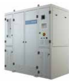
Proteus プラズマ式除害装置